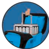
取り出し簡単フィルター