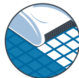
ブラッシング機能