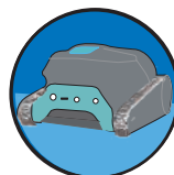
清掃後壁際停止機能