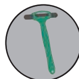
クリックカー誘導回収機能