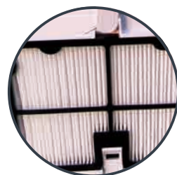
濾過密度50 \mu m